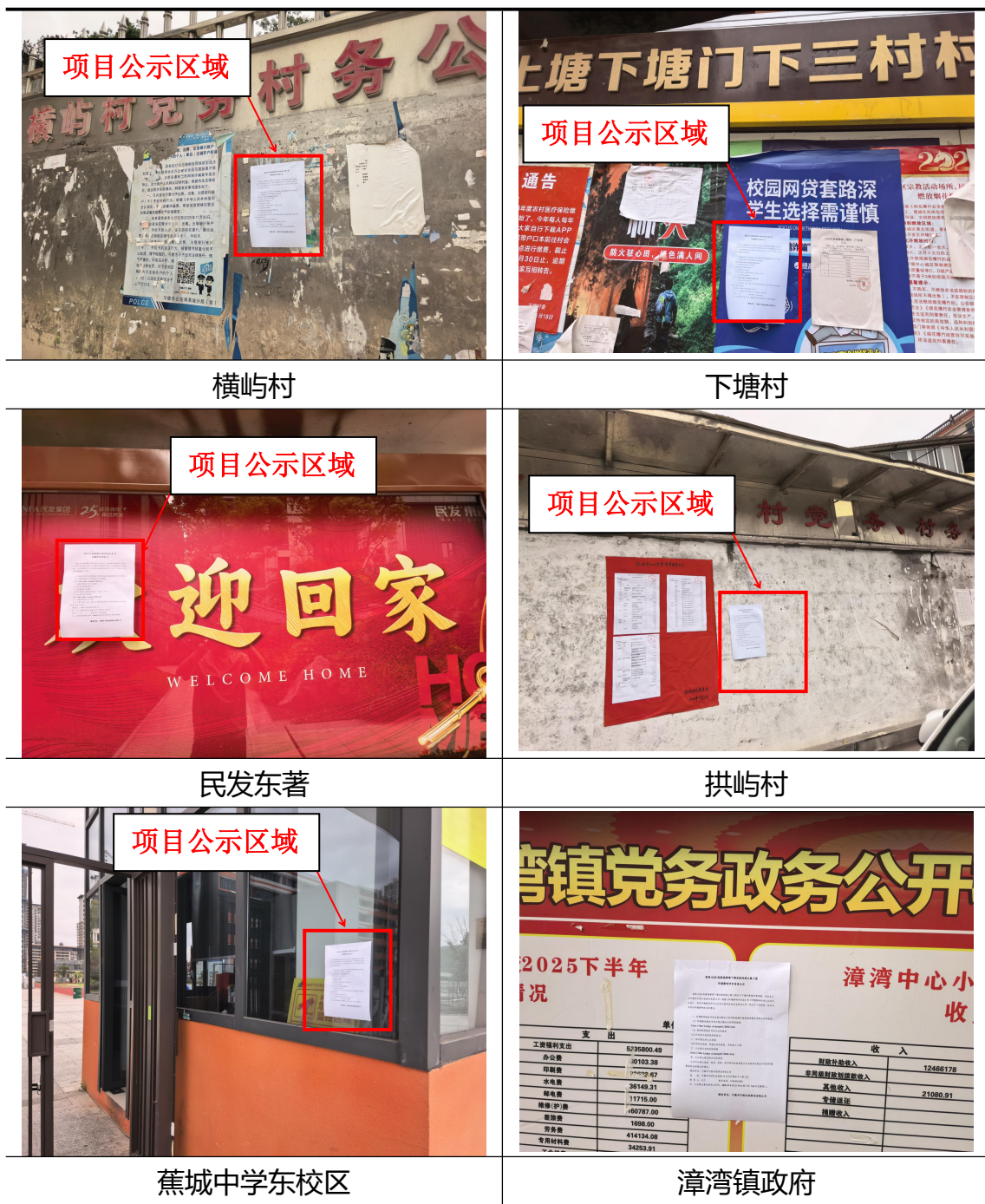
图 5 征求意见稿现场张贴公示

我单位于 2026 年 4 月 21 日~5 月 7 日期间，在项目所在地横屿村、拱屿村、下塘村、蕉城中学东校区、民发东著、漳湾镇政府等的公告栏张贴现场公示。张贴照片如下。