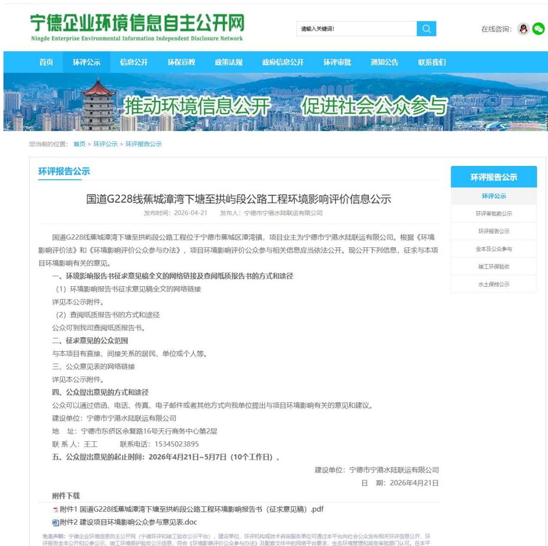
图 2：征求意见稿网站公示